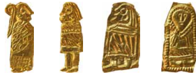
Exempel på så kallade guldgubbar som hittats i Västra Vång. Både män och kvinnor är avbildade.