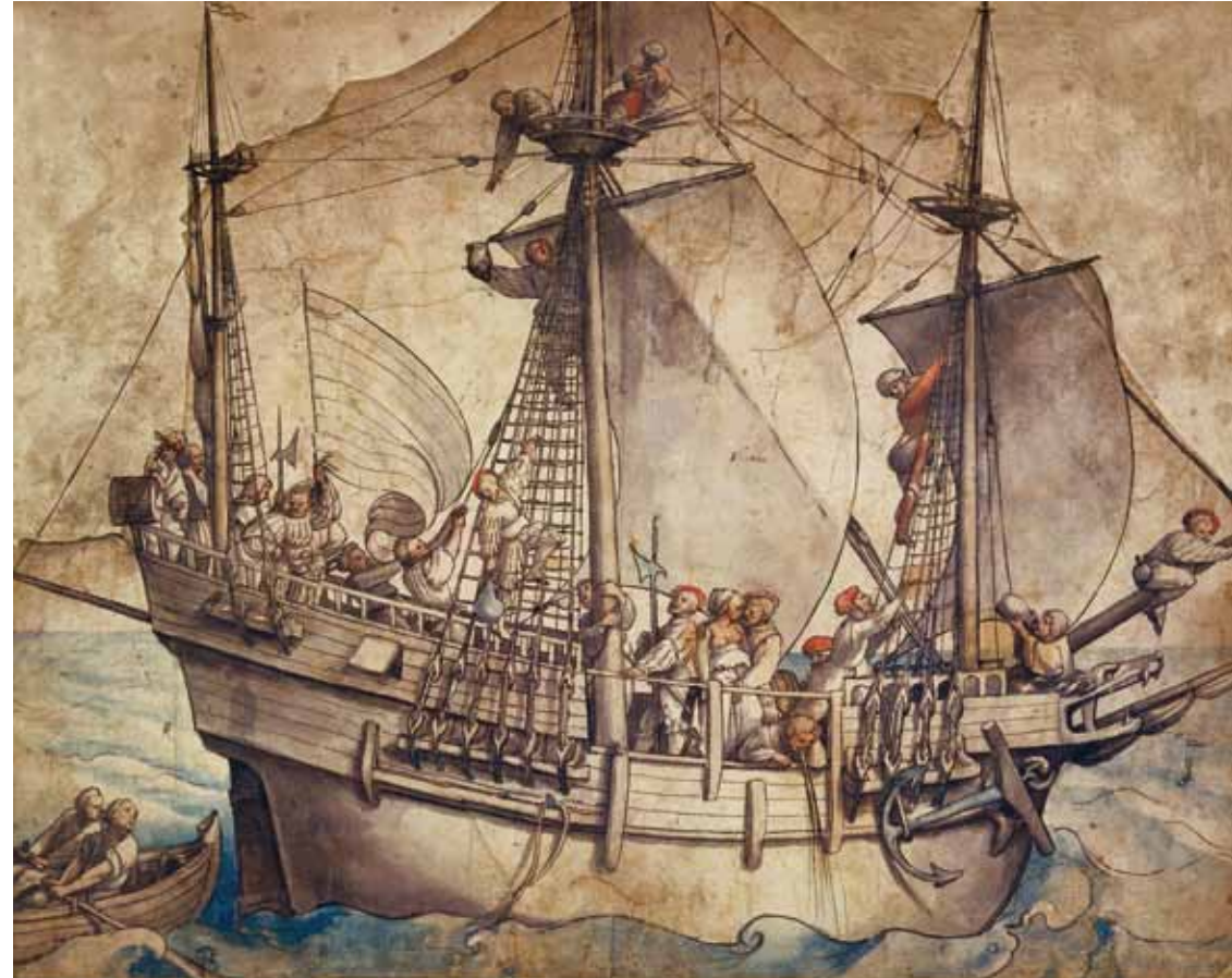
Allegorisk målning av en karack. "Vad händer om skeppet saknar kapten?" Hans Holbein dy. (1497-1543). Städels Museum, Frankfurt am Main, Graphische Sammlung.