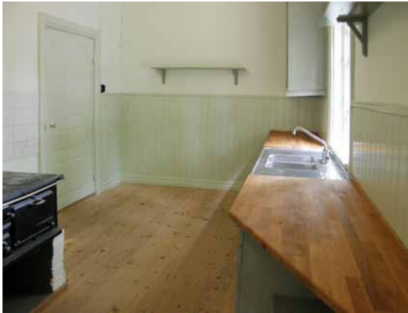
Renoveringen av köket.

Därefter skedde ommålning med linoljefärg i en grågrön färgskala som var modern under 1870-talet – det vill säga tre olika kulörer av samma färgpigment.