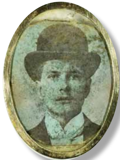
Flera fynd vittnar om Wämöparken som ströv- och rekreationsområde. Små personliga tillhörigheter, som denna lilla berlock från 1900-talets början, finns bland fyndmaterialet.