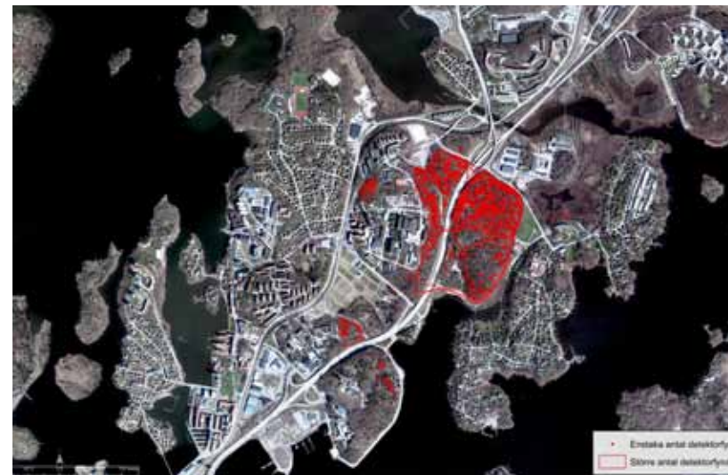
Karta över Vämö som visar var detektorfynden gjorts. GIS-bearbetning Stefan Flöög.

Fyndsamlingen från Vämö visar på hur närmast bortglömda segment av historien kan lyftas fram, och blandningen av såväl civila som militära artefakter gör den i högsta grad pedagogiskt användbar. I fyndlådorna kan utläsas fragment av tidens gång; hur det gamla by- och beteslandskapet med sin landsväg över ön in till staden har försvunnit och järnväg och trafikleder har dragits fram och bostadsområden byggts på utfyllnader som helt har förändrat den tidigare karaktären av en ö utan landförbindelse. Vämös militära förflutna är borta, och