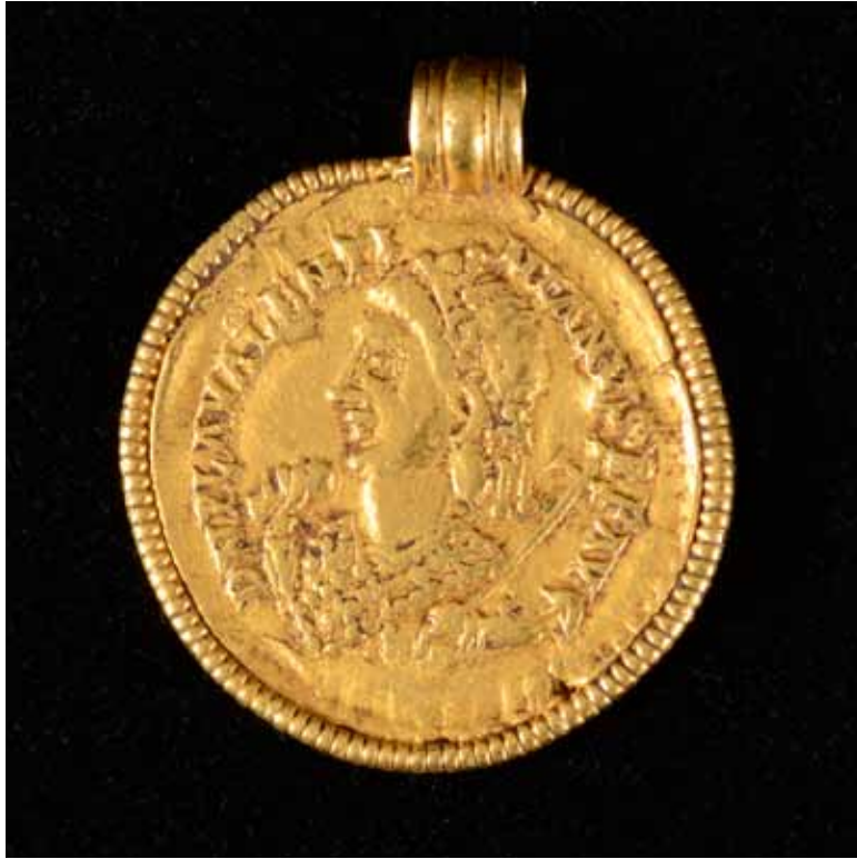
Ett mynthänge tillverkat av en romersk solidus, slaget i Ravenna år 435 e.Kr för den romerske kejsaren Valentinianus III. Hänget påträffades av en lantbrukare i en åker nära byn Hammarby i östra Blekinge.