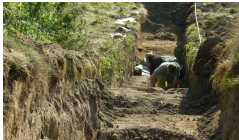
Undersökning av borgens norra vallgrav. I detta schakt framkom vindbryggan.

Förstörelsen 1564 var inte första gången Elleholm utsattes för härjning. Minst två gånger tidigare hade angripare sett orten som ett lämpligt mål; dels 1436 under Engelbrektsupproret (då Elleholm fortfarande var en by) och 1525 i samband med Sören Norbys Skånska uppror. Vid härjningen 1525, som utfördes av hanseatiska trupper, förstördes även borgen – som kallades för Sjöborg. Denna hade troligtvis inte hunnit återuppbyggas vid tidpunkten för reformationen. Så kungen lät med all sannolikhet låta uppföra en ny administrativ byggnad, vid öns södra spets: föregångaren till dagens Hovgård. Då Elleholm upphört att vara stad avvecklades successivt stadsbebyggelsen, vilken kom att