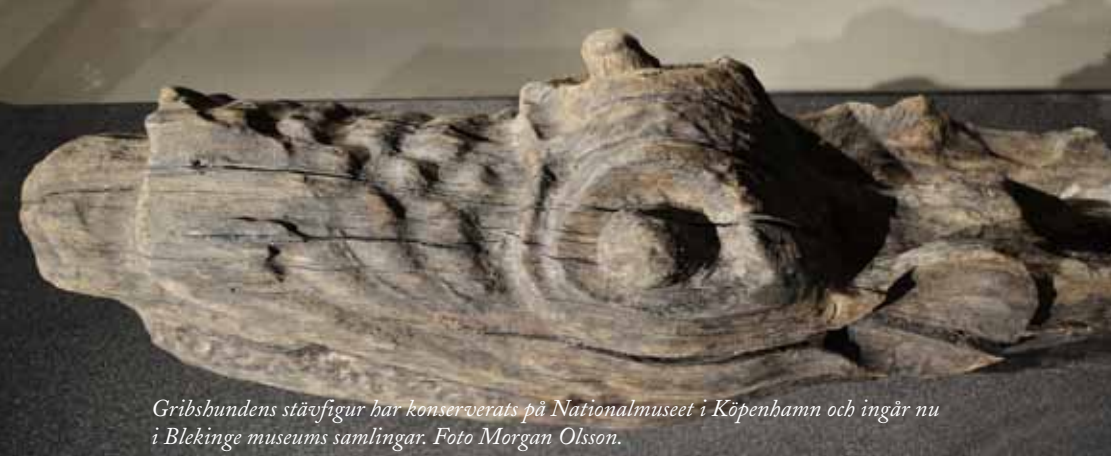
Gribshundens stävfigur har konserverats på Nationalmuseet i Köpenhamn och ingår nu i Blekinge museums samlingar.