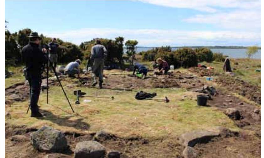
Forskningsgrävning på ön Öppenskar 2016.

järnåldern. Här handlar det, precis som i annan arkeologi, också om att titta bakom fasaden av alla guldglänsande praktföremål och försöka synliggöra det vardagliga och mer oansenliga. Gravfältet Store backe, även känt som "Snarket", är en plats som på nytt uppmärksammas och parallellt med detta pågår arbete med lämningar ute på öarna Inlängan och Öppenskar.