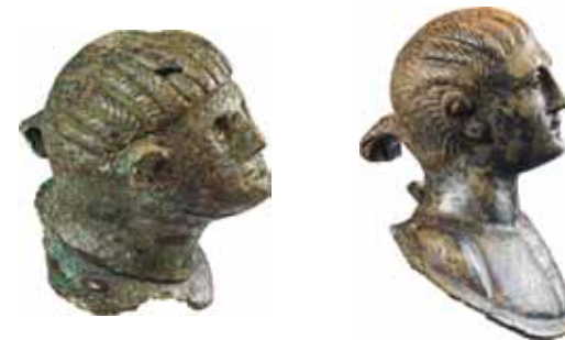
Huvuden av brons. Den till vänster kan vara tillverkad lokalt medan den andra kommer från romerska riket. Troligen har de varit fastsatta på rituella kärl.