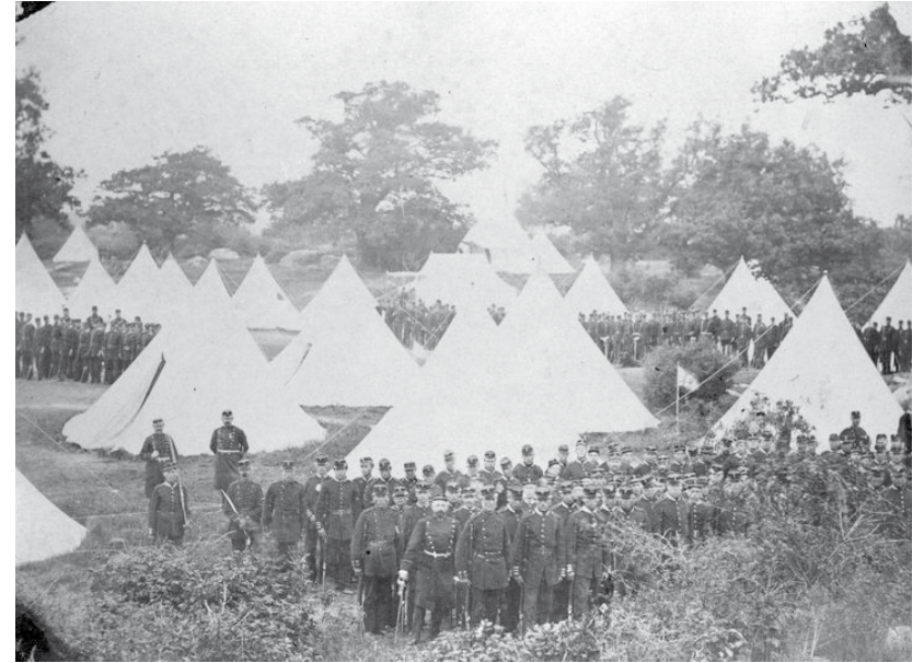
Blekinge Beväring och Marinregementes övningsplats på Wämöslätten i Karlskrona år 1876. Blm OF 02278.

området har blivit en ny stadsdel. Som sådan utgör Vämö fortfarande ett resursområde för staden; i dag kanske mest förknippat med strövområdena och grönytorerna i Wämöparken.