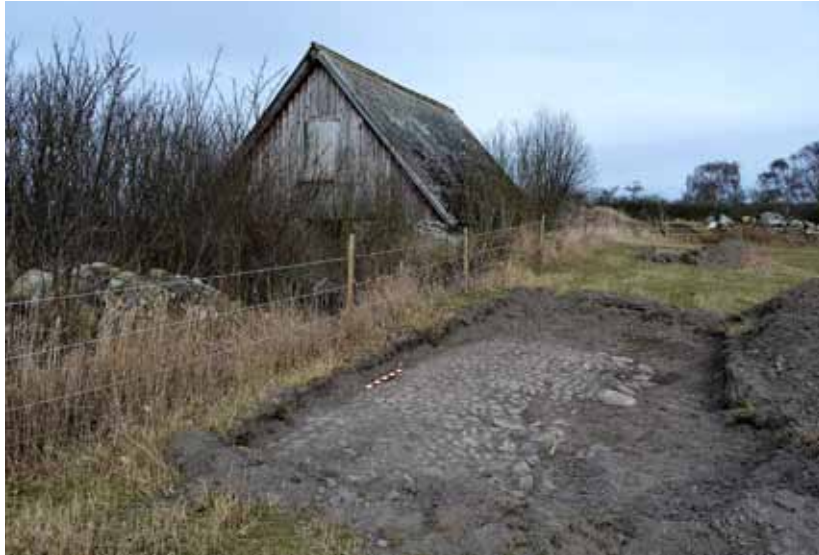
Spår av Siretorps gamla by ovan mark och under jorden.