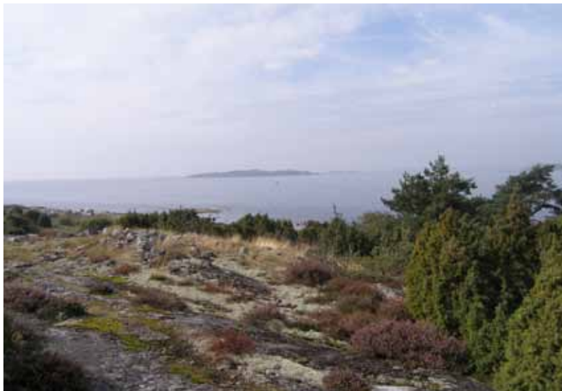
Stora Ekön sedd från Dunsö.