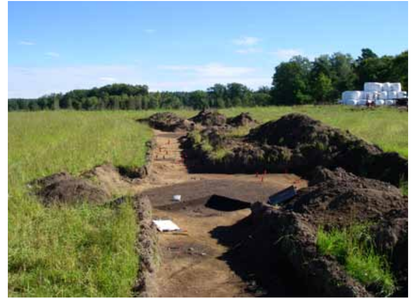
Ett vikingatida grophus i Västra Vång 2007.

Exploateringsarkeologin i Vång kom omkring 2010 att förändras i riktning mot ett mer renodlat forskningsprojekt, vilket i någon form är planerat att pågå ytterligare flera år. Samarbetet involverar förutom Blekinge museum och Lunds universitet även Södertörns högskola, Sensus studieförbund och genom åren åtskilliga volontärer från både Blekinge och Kronoberg. Västra Vång har kommit att bli ett gott exempel på utförandet av ett långsamt och metodiskt kunskapsprojekt, förankrat i både forskarvärld och lokalsamhälle.