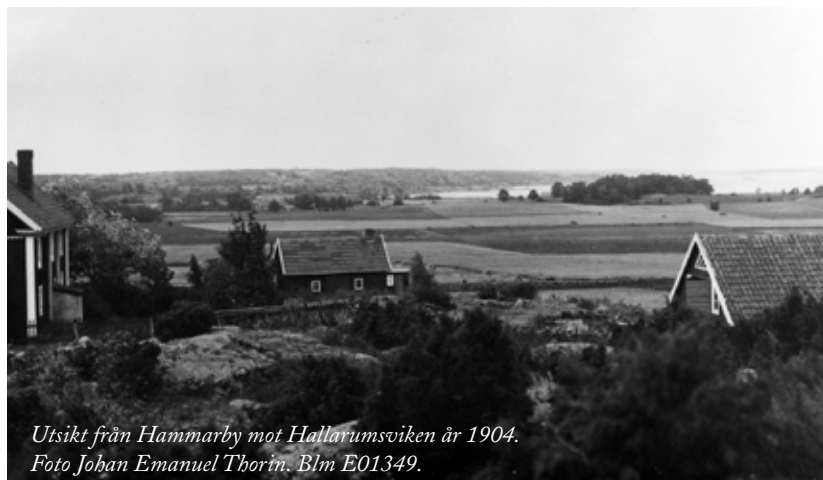
Utsikt från Hammarby mot Hallarumsviken år 1904. Blm E01349.