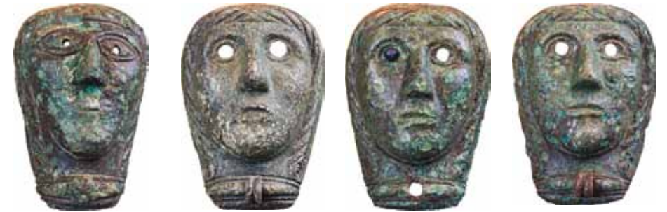
Fyra masker av brons har hittats i Vång. De dateras till århundradena kring Kristi födelse och kan kopplas till den keltiska kultursfären. Masken längst till vänster kan möjligen vara tillverkad lokalt. En av dem har ett bevarat öga av blått glas. Höjd 7,5-8 cm, bredd 5-6 cm.