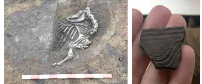
T.v kadavergrop med 1500-talskossa. T.h Slavisk keramik funnen i Siretorp 2015.

Dagens Siretorpsarkeologi kan förstås inte enbart bryta ny mark. Den har att förhålla sig till mer än 100 års forskningshistoria kring en kraftigt förändrad kulturmiljö. Det som en gång endast var sanddyner på utägorna till en bondby har utvecklats till ett tättbebyggt och attraktivt sommarstugeområde i ett strandnära läge.