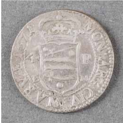
Ett av de mer intressanta fynden gjordes vid Västra Mark i den nordvästra delen av Vämö. Ett föremål som kanske kan kopplas till Karlskronas anläggning år 1680. Ett så kallat besittningsmynt, präglat i staden Narva i dagens Estland, år 1671.