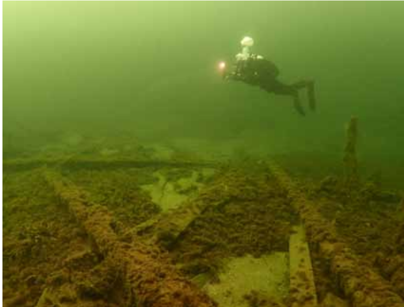
Dykningar på vrakplatsen.