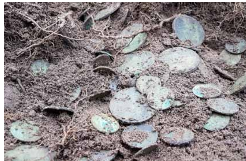
Ett stort antal mynt har hittats på Vämö. Flera kan dateras till 1600-talets andra hälft.