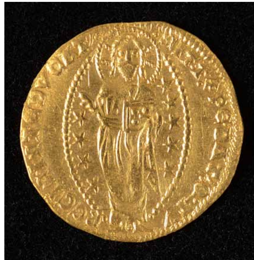
Vid den arkeologiska utgrävningen på Elleholm 2018 påträffades mycket överraskande bland annat en dukat från Venedig, präglad under doge Andrea Dandalos tid (1343–1354). Det är den enda medeltida venetianska dukaten som påträffats i Sverige – och detta på ärkebiskopens borg Sjöborg, belägen på platsen för medeltidsstaden Elleholm. Den ena sidan av myntet visar St Markus som överröcker ett standar till doge Dandalo. Den andra sidan visar Kristus inom en s.k. mandorla (även benämnd mandelgloria, d.v.s. en upprättstående "mandelformad" ljusgloria, som ofta omger Kristusgestalten i medeltida konst).