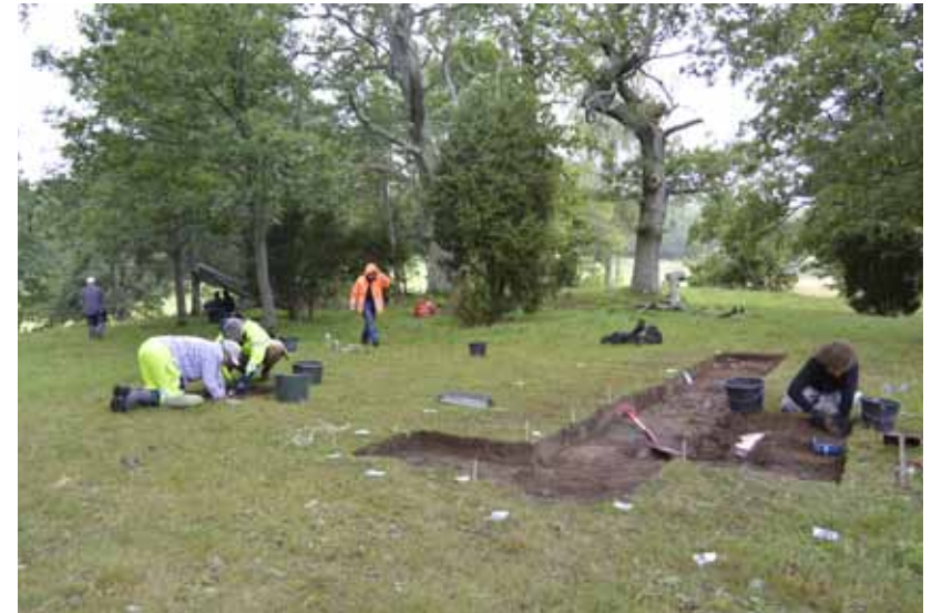
Undersökning av kultplatsen i Västra Vång 2017.