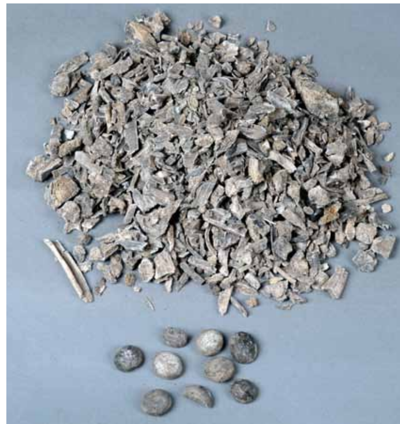
Kremerade ben och spelpjäser från gravfältet Store Backe vid Hallarumsviken.