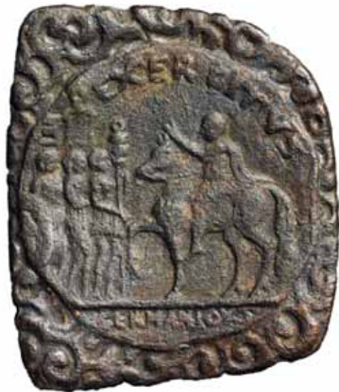
Romartida eller sentida? Förbryllande lösfynd från Siretorp.