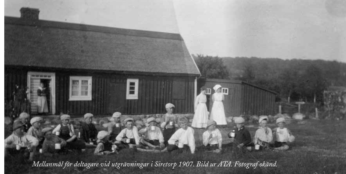
Mellanmål för deltagare vid utgrävningar i Siretorp 1907.