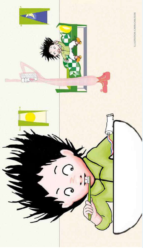
ILLUSTRATION: CARIN GANLSSON

شیرینی، کیک و خوارینه وه گازی به کان بۆ نه وه ی که وره ببین و که شه بکه بین پۆبستیمان به خورینی جۆراو جۆره. زۆر باشه نه که ر شیرینی ، کیک، شه کرله مه ، چپس و خوارینه وه گازی به کان تا نه توانیت نه بده بت به منداله کان. باشترین خوارینه ت نه وه به که نه نه یه ک رۆژ له هه فته به کدا شیرینی بدریت به مندال بۆ نمونه رۆژی شه ممه.