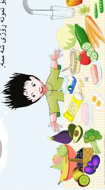
ILLUSTRATION: CARIN GANLSSON

شیرینی، کیک و خوارینه وه گازی به کان بۆ نه وه ی که وره ببین و که شه بکه بین پۆبستیمان به خورینی جۆراو جۆره. زۆر باشه نه که ر شیرینی ، کیک، شه کرله مه ، چپس و خوارینه وه گازی به کان تا نه توانیت نه بده بت به منداله کان. باشترین خوارینه ت نه وه به که نه نه یه ک رۆژ له هه فته به کدا شیرینی بدریت به مندال بۆ نمونه رۆژی شه ممه.