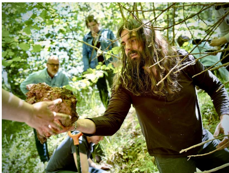
Bild från lerexkursionen Gräv där du står.

Arbetet skedde även inom ramen för projektet Möt Mästaren.